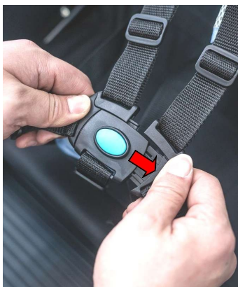
Tryk på knappen for at frigøre spænde fra begge sider.