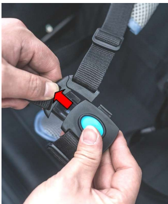
Tryk på knappen for at frigøre spænderne fra begge sider.